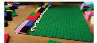
MONTER D'UN ETAGE TOUTE LES DEUX LIGNES