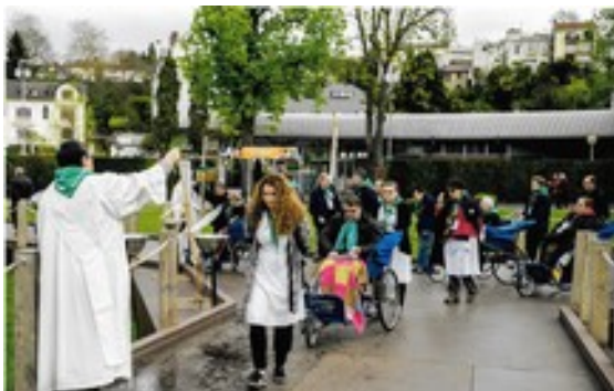
Vers la Croix