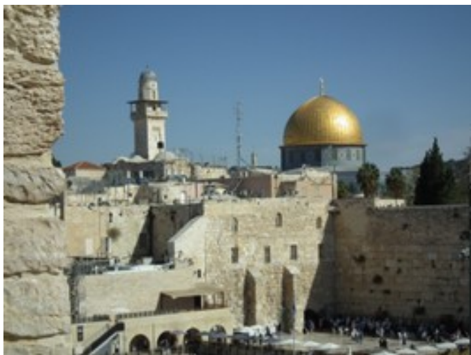
Mur des lamentations

Le coût du pèlerinage se situera aux alentours de 1700 euro pour un séjour de 9 jours. Vous pouvez d'ores et déjà remplir vos tirelires pour assurer ce paiement. Nous établirons un échéancier pour un paiement échelonné dans le temps. Tout devrait être réglé fin août 2018. Nous avons 24 mois avant l'échéance ce qui fait environ 71 euros par mois. Il nous faut être au minimum 44 pèlerins.